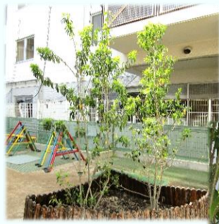
新芽が元気よく出てきています。

サクランボやいちご、桑の実、ゆすらうめなど食べられる実がなる木があるのですが、その実のほとんどは熟す前にもぎ取られがち。売られている果物ではなく木の実が熟していく経過を見た上で食べてみる経験ができるようにと願いつつ、青い実を大事そうに握っている子どもたちに、苦笑いの先生たちです……。