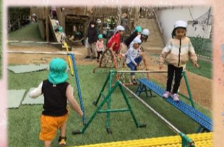
鉄棒や平均台を並べてサーキット遊び。“もう一回!”なんども繰り返し楽しんでいます。