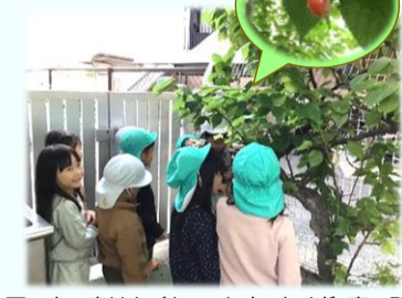
下の方の実はなくなりましたが、高い所に少しだけ実がなってる…。さあ、どうやって分けようかな…