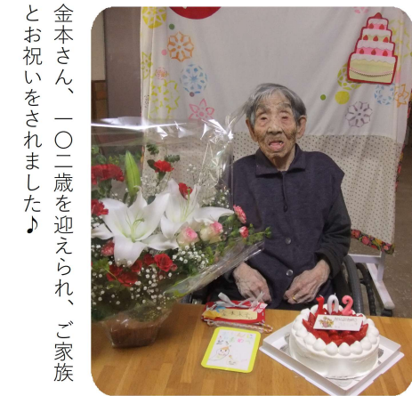
金本さん、一〇二歳を迎えられ、ご家族とお祝いをされました♪