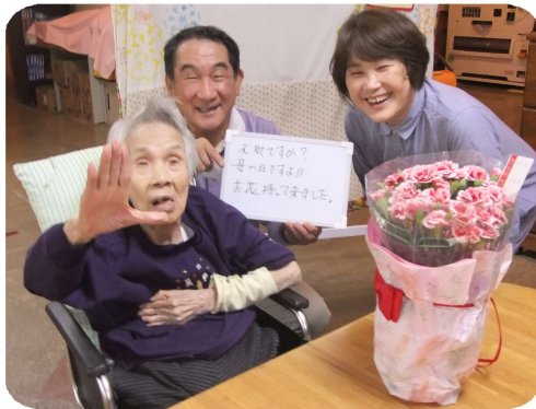
麻生さん、神戸から息子さんご夫婦が母の日のお祝いに♪