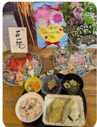
敬老の日御膳です。手作りの羊羹、とっても美味しかったです!

十二件の発表を聞いてとても感動しました。一つ一つ丁寧な取り組みを、施設、グループ、多業種連携で行われていて大変勉強になりました。一件目のグループの発表は、私たち介護士が不安に思うこと、看取りの手順など迷うことを取り上げられ、思わず涙しながら聞いていました。二件目の「ハッピーに毎日を過ごせるために」でのハッピーライフクラブの活動では、利用者さんに楽しく過ごしてもらうために考え、行動実践されていることに感動しました。難しい時の代替案を用意するとか、無理ならやめようとならないところが素晴らしいです。中でも思い出の地巡りを動画で実況する活動は、利用者さんのためにここまでできるのかと驚きました。 「うどんが食べたい」がテーマの発表では、ご本人の状態を見て、あきらめがちなケースをリハビリからの目標を意識しての声掛けなど、全職員が一丸となって取り組まれ、本当に食べられるところまで達成目標のある生活、達成する喜びは利用者さんにハリのある毎日を提供できると思われれます。中でも一番心に残ったのは、食欲のなくなった利用者さんの気持ちを大切に、家族との話し合いをし、大好きなビールとおつまみを提供した話です。最期の時を好きなものも食べれずに亡くなった父を思い出し、涙が出てしまいました。本当に大切なことは何かを教えられた気がしました。心から感謝と尊敬の念に堪えませんが、私もこの感動を持ち帰り、活かせることができましたらと強く心に刻みました。