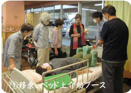
① 移乗 ベッド上介助コース