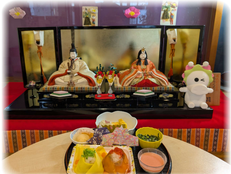
ひなまつり御膳です。お雛様にたまごを焼きを巻き巻き。三色ゼリーも手作りです。きれいにできあがっていましたよ！